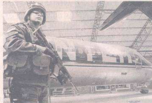
EN EL AEROPUERTO Eldorado de Bogotá, miembros de la Dijín inmovilizaron ayer las nueve aeronaves propiedad de Intercontinental.

El Departamento del Tesoro de Estados Unidos había incluido, el pasado 14 de octubre, a Puerta Parra y a la empresa en la lista de compañías con vínculos con el narcotráfico. 'Intercontinental de Aviación S. A. facilitó el tráfico de cocaína y el lavado de activos desde finales de los 80's. Varias compañías de fachada, que de alguna manera proveían o prestaban servicios a la aerolínea.